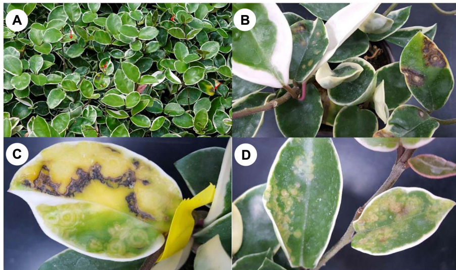
Fig. 1. Disease symptoms induced in Hoya carnosa plants by Impatiens necrotic spot virus (INSV). (A) Chlorotic and necrotic ring spots on leaves in natural field. (B) Brown to dark brown, necrotic spotting in middle leaves of the plant. (C, D) Chlorotic spots and necrosis of leaves.

Orthotospovirus 속의 바이러스 중 의심되는 토마토반점위조 바이러스(TSWV), 봉선화괴저반점바이러스(INSV) 및 토마토 퇴색반점바이러스( Tomato chlorotic spot virus , TCSV) 3종의 바이러스 등에 대한 특이 프라이머를 이용하여 RT-PCR 하였다(Table 1). 결과 원형반점 등의 증상을 보인 호야 3점은 봉선화 괴저반점바이러스(INSV)에만 양성반응을 보였다. 건전해 보이