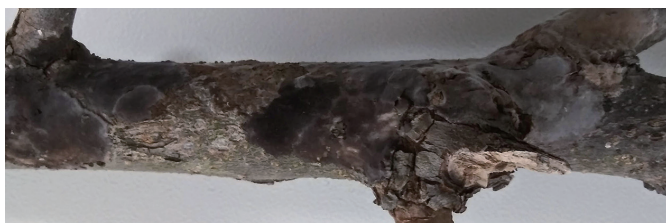
Fig. 2. The surface of infected mature branch caused by Septobasidium sp. on Diospyros kaki .

ITS 염기서열 분석. 감에서 분리한 병원균 동정을 확실시하기 위해 rDNA의 complete ITS 영역의 염기서열을 White 등 (1990)이 사용한 2개의 프라이머 ITS1 (5'-TCCGTAGGTGAACCT-GCGG-3')과 ITS4 (5'-TCCTCCGCTTATTGATATGC-3')를 사용하여 PCR로 증폭하였다. 증폭된 PCR 산물은 0.8% agarose gel에서 전기영동 후, ethidium bromide로 염색하여 UV transilluminator에서 밴드를 확인하였다. 확인된 밴드는 QIAquick PCR purification kit (Qiagen, Hilden, Germany)를 사용하여 분리 정제하였고 pGEM-T Easy 벡터(Promega, Madison, WI, USA)에 클로닝한 후 M13F와 M13R 프라이머를 이용하여 염기서열을 분석하였다.