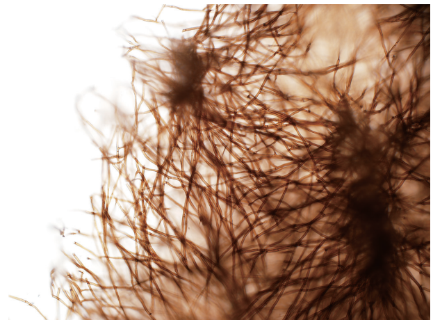
Fig. 3. Morphological characteristics of Septobasidium sp. on Diospyros kaki . Felt disease hypha.