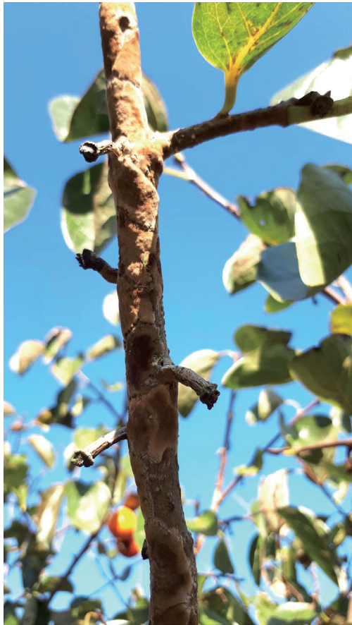
Fig. 1. Typical symptom of felt disease caused by Septobasidium sp. on Diospyros kaki .

Septobasidium 속의 균사 색깔은 처음 열린 갈색이고 배양기간이 경과됨에 따라 가지 표면이 짙은 암갈색으로 변하며 균사가 많이 형성되었다(Fig. 3). 균사생육 적온은 30°C이다.