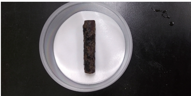
Fig. 5. Felt disease symptom induced by artificial inoculation.

(HM209416)과 92%, Septobasidium bogoriense (HM209414)과 91%의 상동성을 나타내었다.